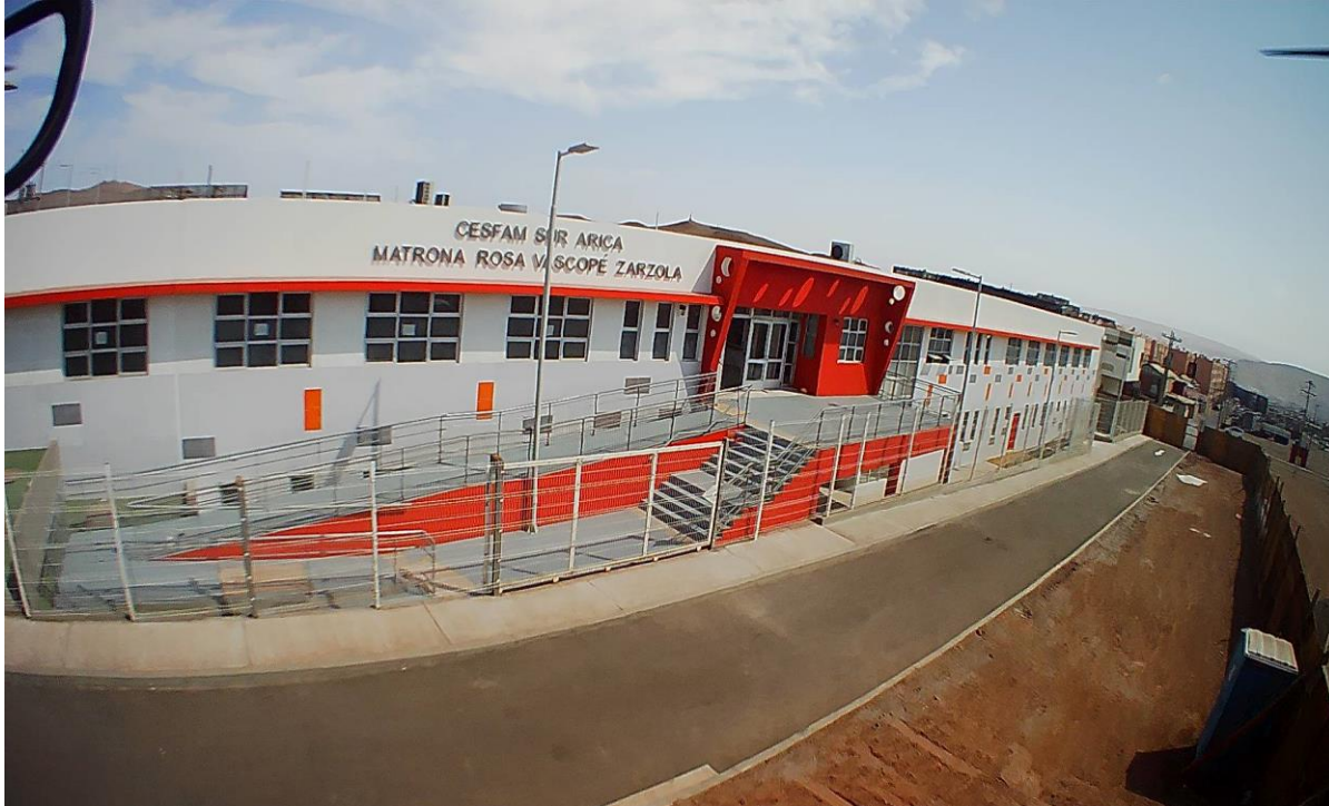
Imagen Proyectada de la Obra:

Monto Pagado al 30-11-2021: $ 6.363.546.820 (todas las asignaciones).