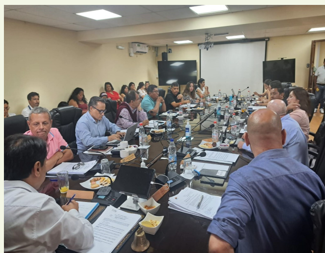
Imagen: IV. SESIÓN ORDINARIA

Destacan en las Sesiones Ordinarias, la aprobación de proyectos en beneficio de los sectores salud, vivienda, pavimentación.