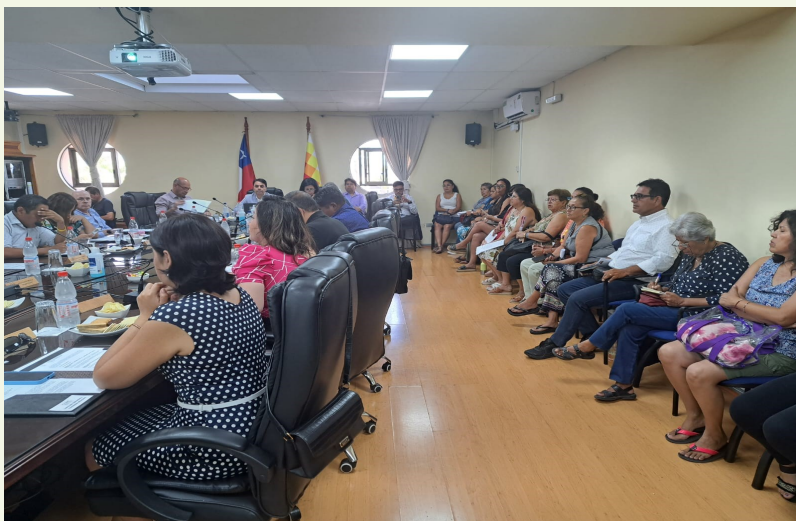
Imagen: III. SESIÓN ORDINARIA