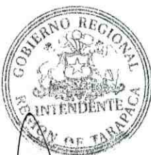
ANTONELLA SCIARAFFIA ESTRADA INTENDENTE REGIONAL DE TARAPACA